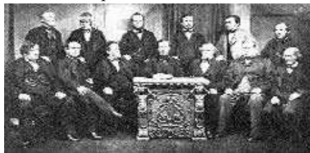
Los pioneros de Rochdale

Así ocurrió. Hoy es fácil comprobar que la economía social no remontó los principios de Rochdale 32 (Manchester), base del movimiento cooperativista: cooperativismo interclasista, matrícula abierta, neutralidad política, un socio un voto, interés limitado sobre el capital, ventas al contado, ganancias que